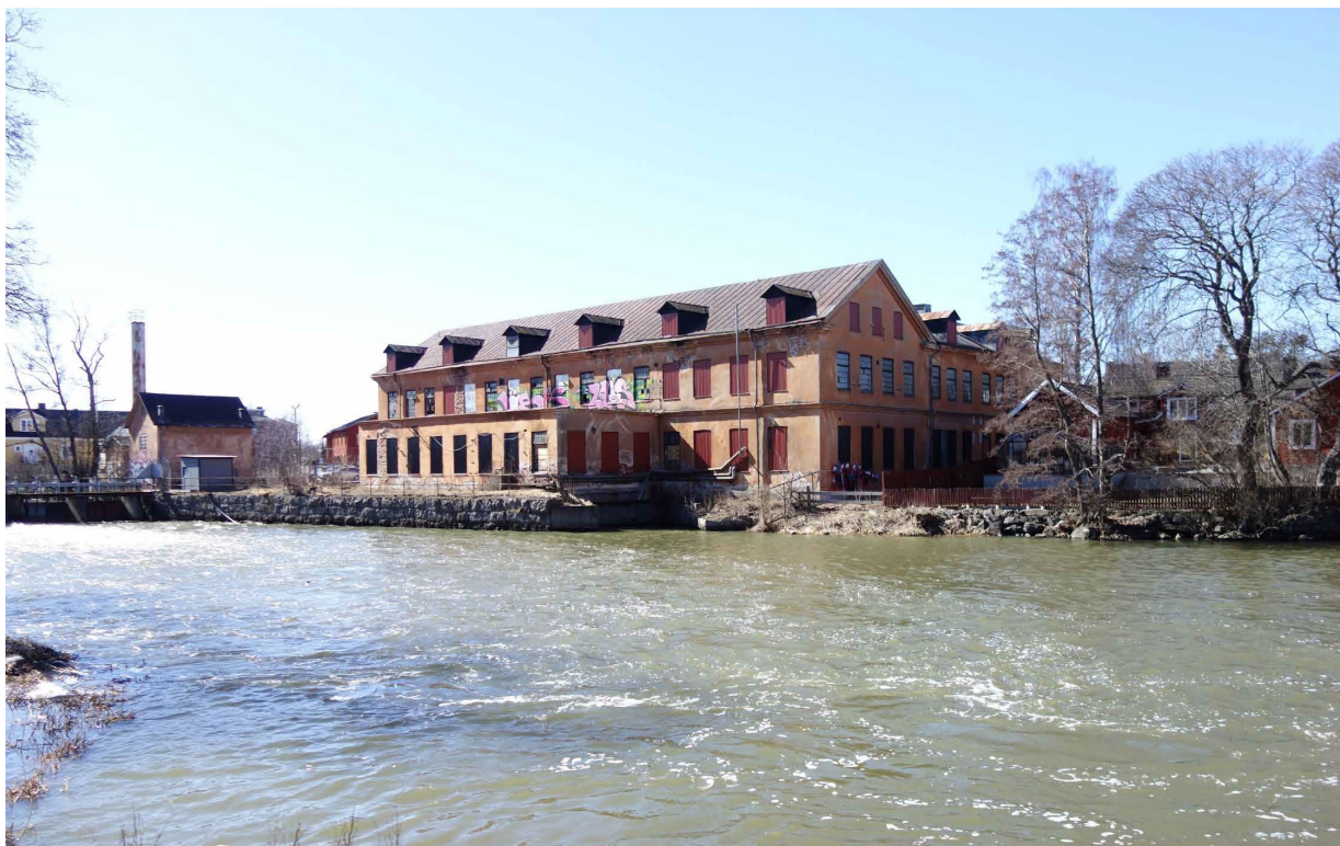
Holmens mekaniska verkstad

Behov av utredningar enligt planbesked; Dagvatten, buller, kulturmiljö, markföroreningar, skredrisk. Behov av fler utredningar kan tillkomma vid fortsatt planprocess.