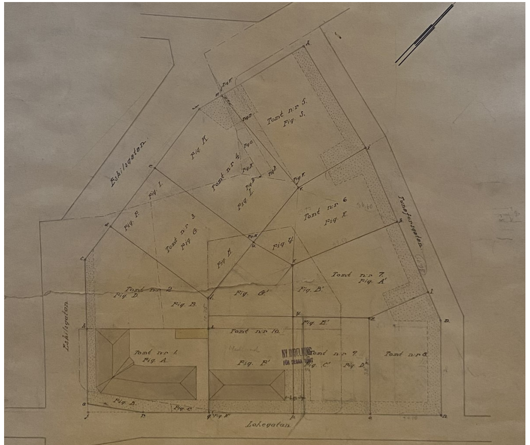
Bild på tomtindelningsskarta 0484K-395C.

Tomtindelningsskarta 0484K-395C upphör att gälla inom fastigheten Snickarboden 2.