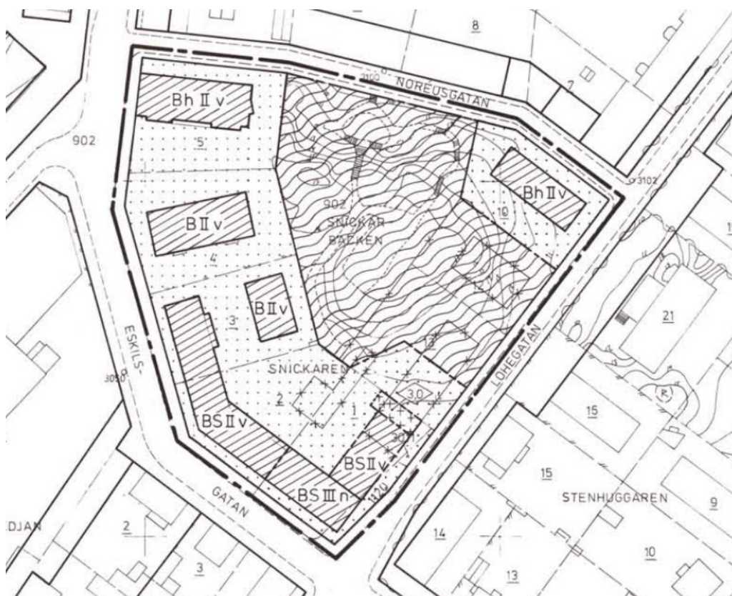
Utdrag från gällande detaljplan för platsen.

Detaljplan Fastigheten omfattas av detaljplan 0484-P84/12, plannummer 2-478 med lagakraft datum 19 juni 1984.