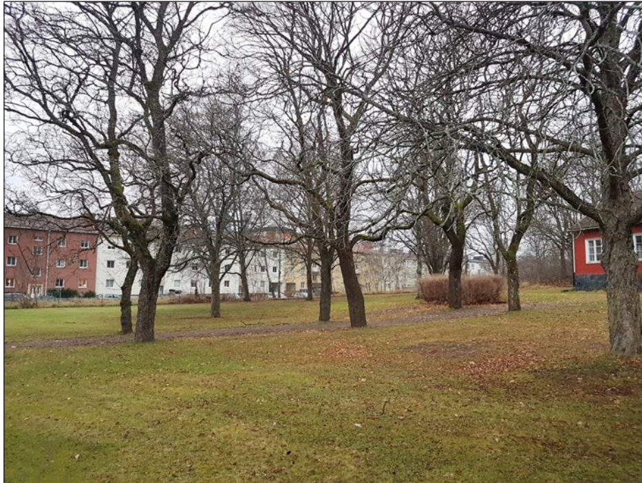
Figur 5. Vy över utredningsområdet. Foto taget från nordväst.