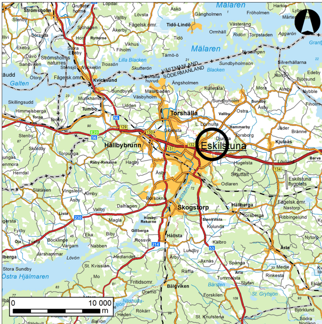
Figur 1. Eskilstuna med området för utredningen markerat med en svart cirkel. Skala 1:250 000.